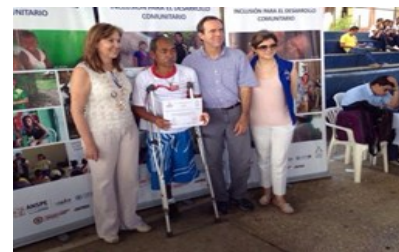
Familias de Montes de María con discapacitados fueron formadas en inclusión