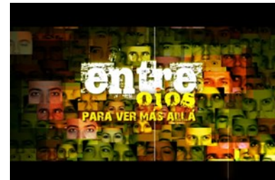
Llega la Televisión con Audio-descripción