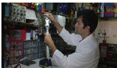
Un colombiano, finalista en concurso científico de History Channel