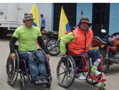
¿Cómo es sobrevivir en una silla de ruedas?