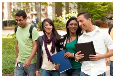
Límites a la autonomía universitaria