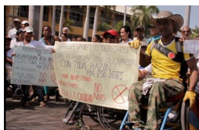
Personas con discapacidad física protestaron en La Castellana contra Teletón