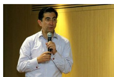
Con 'Ayudapps' se desarrollarán aplicaciones para personas con discapacidad