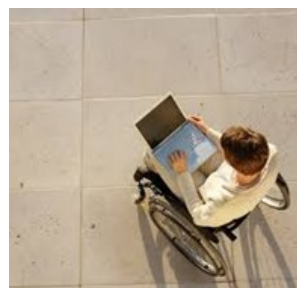
Discapacidad física no es sinónimo de incapacidad