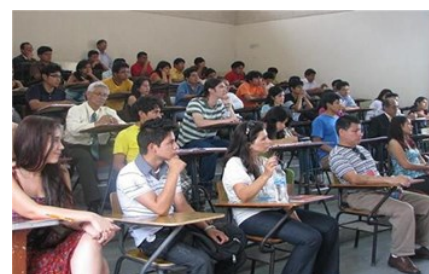
Estudiantes universitarios de Arauca se pusieron en los zapatos de los que tienen discapacidad visual