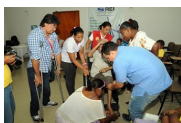
Entregan sillas de rueda medicadas a personas en condición de discapacidad