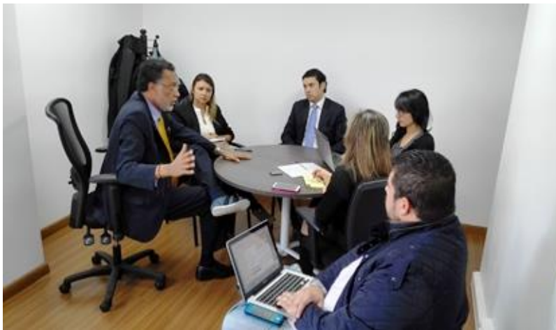
Tomada en la Carrera 13 No. 28-01 Edificio Palma Real