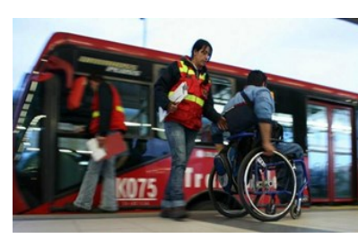
Invitan a prepararse y participar en el primer Cabildo Distrital de Personas con Discapacidad