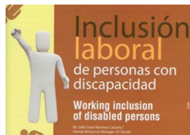
Inclusión laboral de personas con discapacidad