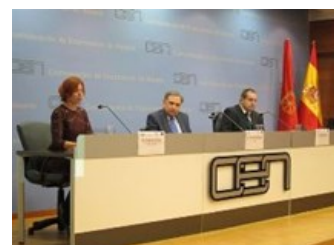
La accesibilidad y el talento de las personas con discapacidad, ventaja competitiva