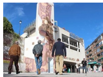
Cáceres es elegida mejor 'Destino Turístico Accesible'