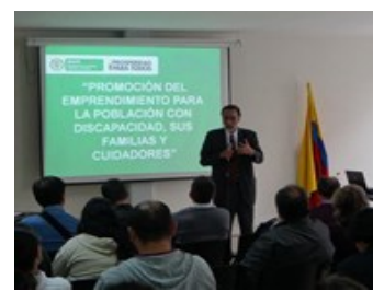
Oportunidades de Empleabilidad y Emprendimiento para Población con Discapacidad