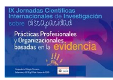
IX Jornadas Científicas Internacionales de Investigación sobre Discapacidad