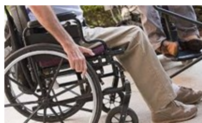
Pensión para las víctimas con discapacidad