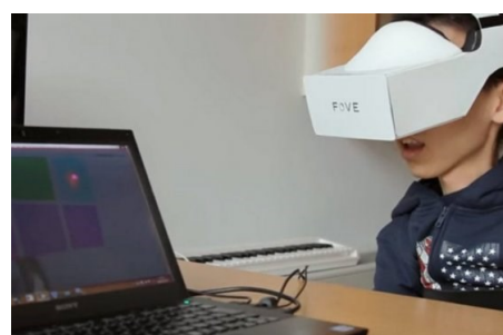
Crean mecanismo que permite a niños con discapacidad tocar el piano con la vista