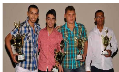
Hoy se conocerá quién es el mejor deportista de 2014