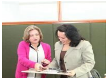
Apoyo a Colombia para la formulación de una política de discapacidad