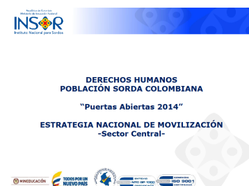
DERECHOS HUMANOS DE LA POBLACIÓN SORDA COLOMBIANA