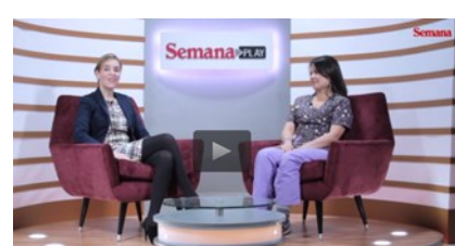
Panorama de la discapacidad en Colombia