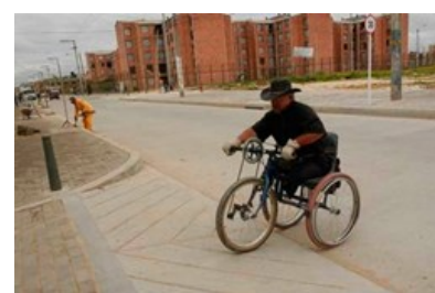
Critican al Distrito por falta de adecuaciones arquitectónicas para discapacitados