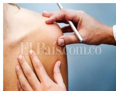
La lepra Olvidada más no erradicada