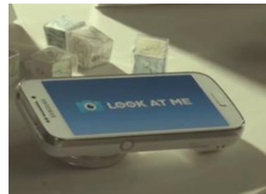
Samsung lanza "Look at Me" una aplicación para niños autistas