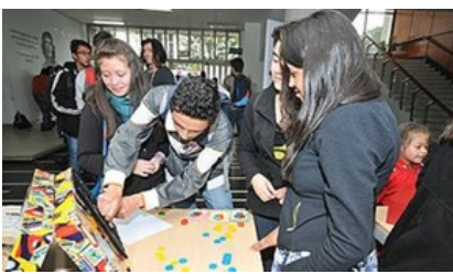
Discapacidad: juegos adaptados a personas con limitaciones