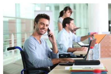
Favorecen la inclusión social de personas con discapacidad