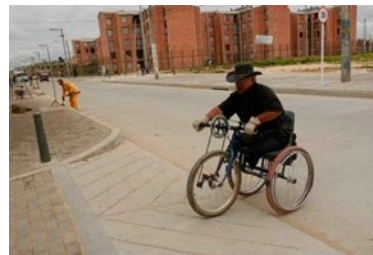
La situación de personas discapacitadas en Colombia