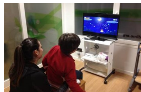
Estudian los beneficios de la Wii en niños con discapacidad motriz