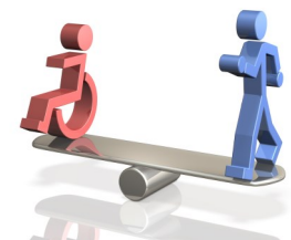
Incentivos o beneficios para las personas en condición de discapacidad