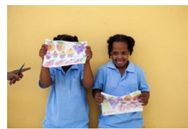
Miseria y discapacidad: el mayor reto para una escuela