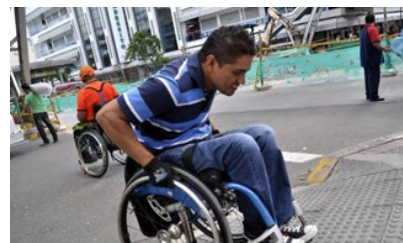
Ni el Gobierno sabe cuántos discapacitados hay en Colombia