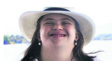
La emprendedora paisa con down que genera oportunidades