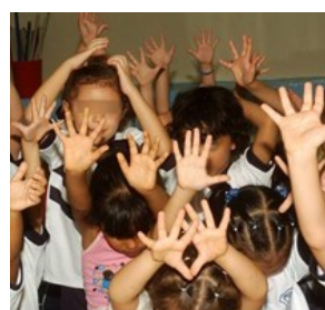
Abren inscripciones para programa de niños con discapacidad cognitiva