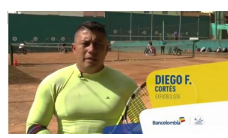
Este futbolista, en silla de ruedas, goleó al pesimismo y la adversidad