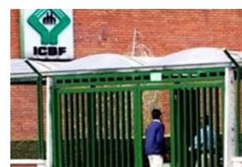
Niños discapacidad cognitiva en medio polémica Icbf y Fundación en Armenia