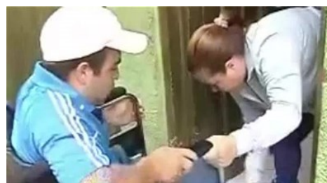
Usuario en condición de discapacidad vive drama en