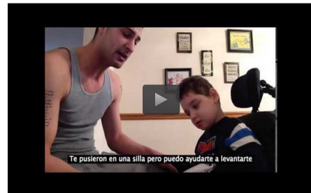
La canción de un padre a su hijo discapacitado que emociona a miles