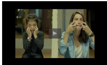
La discapacidad vista por los niños