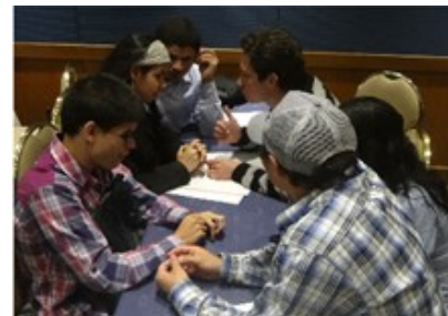
Sí hay formas de acceder a la educación superior