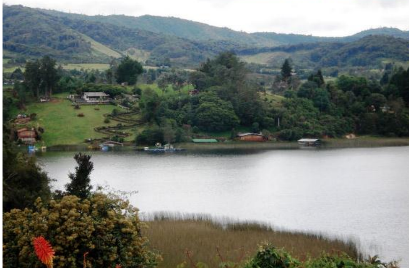
LAGUNA DE LA COCHA NARIÑO, COLOMBIA