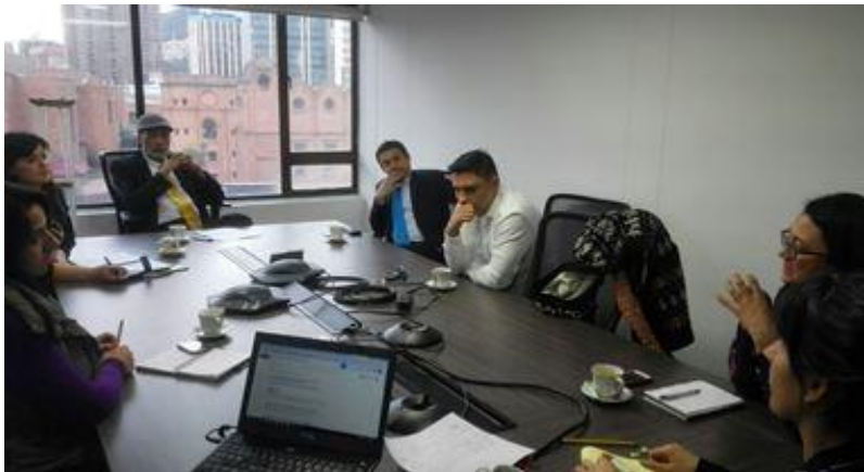
Lunes 09 de Septiembre de 2015.

El pasado lunes 09 de noviembre del 2015 el Equipo de Trabajo en Gestión en Discapacidad llevó a cabo una reunión con el Ministerio de las Tecnologías de la Información, Ministerio del Interior, Ministerio de Agricultura, La Fundación Saldarriaga Concha y el Servicio Nacional de Aprendizaje – SENA.