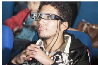
La tecnología facilita la vida de las personas con discapacidad