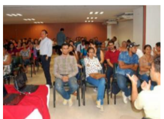
Avanza creación de Política Pública de Discapacidad de Barrancabermeja