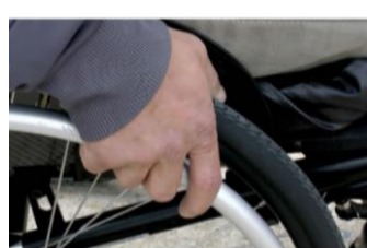
Ban ki-moon pide acabar con estereotipos y discriminación a personas con discapacidad

Trabajamos para ser mejores, su opinión es muy importante para nosotros, lo invitamos a dejar sus comentarios, reclamos, sugerencias y/o agradecimientos a: